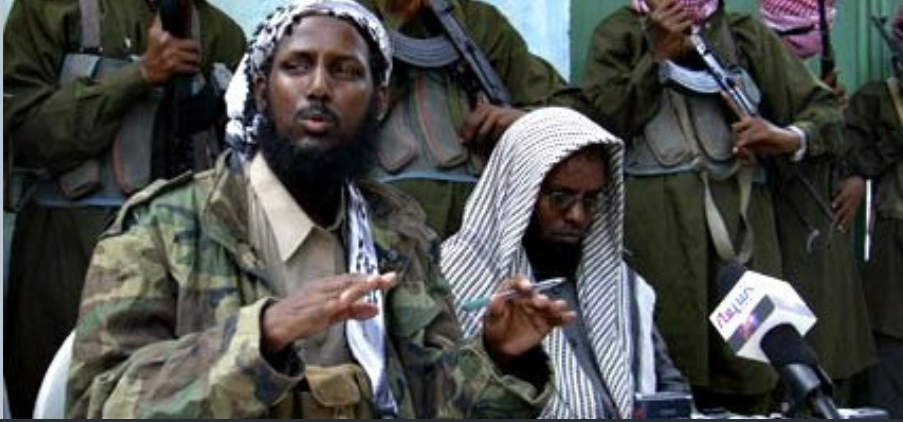
ŞEYH MUHTAR ROBOW, KONUyla İLGİLİ AÇIKLAMA YAPARKEN...

Şu an Somali'de faaliyet gösteren çeşitli organizasyonlarla alakalı bir yılı aşkın çok titiz bir çalışmanın ve incelemenin ardından Yabancı Ajanslarla İlişkileri Koordine Etme Ofisine (OSAF) bağlı olarak çalışan Delil Bulma Komitesi, kimi organizasyonların yapmış olduğu caiz olmayan ve kötü niyetli aktivitelerle alakalı yüksek güvenilirliğe sahip iç ve dış kaynaklardan gelen bilgileri baz alarak detaylı bir rapor hazırlamıştır.